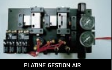
PLATINE GESTION AIR