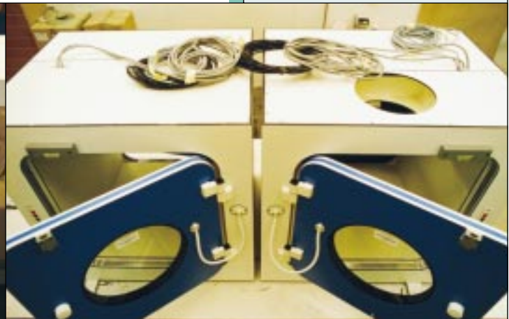
EDF/P3, CENTRALE DE NOGENT SUR SEINE, DAMPIERRE, CHOOZ CIVAUX