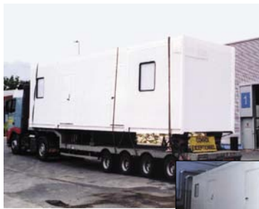
HÔPITAL LYON CROIX ROUSSE