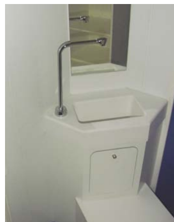
LABORATOIRE DE SUBSTITUTS CUTANÉS, HÔPITAL EDOUARD HERRIOT SKIN REPLACEMENT LABORATORIES AT THE EDOUARD HERRIOT HOSPITAL