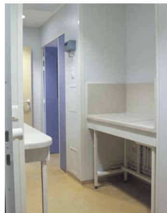
12 SALLES STÉRILES, PITIE SALPETRIERE / 12 STERILE AREAS AT THE PITIE SALPETRIERE HOSPITAL

La maîtrise des infections croisées et nosocomiales requiert une approche pluridisciplinaire. La technologie de LSB® permet de répondre efficacement aux normes d'hygiène de l'environnement médical en conformité avec les recommandations du CLIN (Comité de Lutte contre les Infections Nosocomiales). LSB® met en œuvre le TRESPA et le CORIAN depuis plus de 20 ans. Notre technologie, nos équipements numériques et la compétence de nos compagnons vous assurent une réalisation de qualité bénéficiant de la garantie des fournisseurs TRESPA et DUPONT DE NEMOURS.